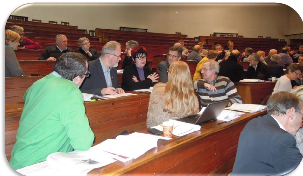
Tijdens de vormingssessie voor schoolbesturen over bestuurlijke schaalvergroting en organisatieveranderingen op 20 januari 2015 in Mechelen

Drie maal per jaar komt er een 'uitgebreide taskforce BOS' samen. De taskforce wordt dan uitgebreid met de diocesane ankerpersonen die de besturen ondersteunen en de vijf halftijds gedetacheerde procesbegeleiders (één per bisdom). Die laatsten worden maandelijks bijeengebracht in een 'begeleidingsgroep' voor het uitwisselen van ervaringen.