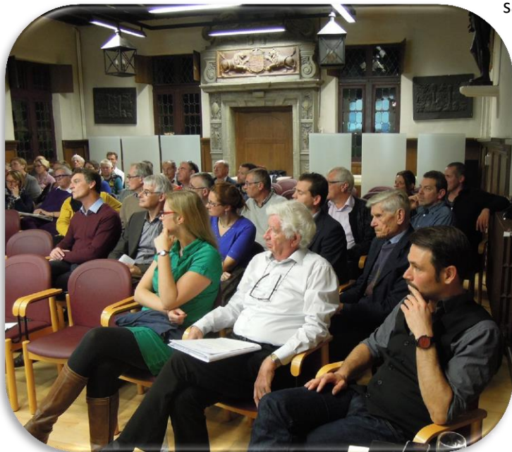
Schoolbestuurders en directeurs uit de oostrand rond Brussel bij elkaar in de Abdij van Kortenberg op 21 oktober 2015

dat men graag wil behouden. Een ander verbindend element is dat de coördinerende directeurs van de drie scholengemeenschappen al een paar jaar een gemeenschappelijke werkplek hebben in de Abdij van Kortenberg en al heel goed en nauw samenwerken.