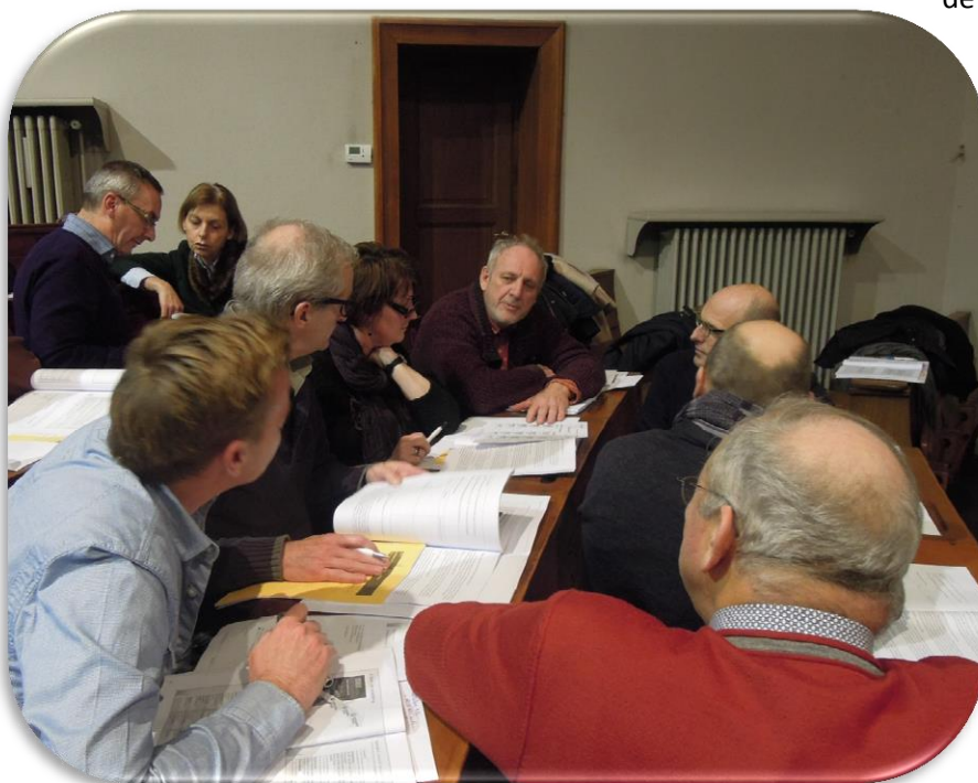
Tijdens de vormingssessie voor schoolbesturen over organisatieveranderingen op 20 januari 2015 in Mechelen

de fase waarin ze zich met de BOS-operatie bevinden zijn heel verschillend. Maar ook de situatie van de schoolbesturen verschilt vaak: in sommige bisdommen zijn er bijna geen congregaties of andere niveau-overstijgende schoolbesturen actief. In het aartsbisdom is een derde van de leerlingen ondergebracht in congregatiescholen en bestaan er daarnaast ook nog heel wat niveau-overstijgende schoolbesturen. In Mechelen-Brussel zijn we een jaar of twee vroeger gestart met de sensibilisering van schoolbesturen, waardoor we vaak voorop lopen en vragen doorgeven aan de koepel waarop die zich nog niet goed heeft kunnen voorbereiden. Dat laatste verandert nu, dankzij de expertiscellen die uitgebouwd worden rond vragen van juridische, financiële, infrastructurele en organisatorische aard.