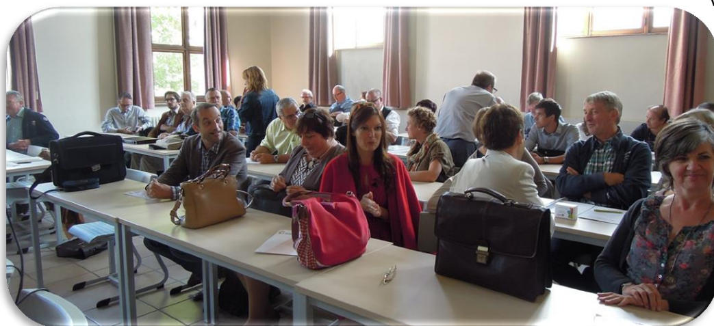
De pedagogische begeleiders en het personeel van het Vicariaat onderwijs waren talrijk aanwezig bij de startdag