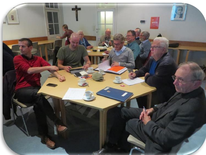
Brusselse schoolbestuurders en directeurs bij de ondertekening van een intentieverklaring in het De la Salle-centrum

In de hoofdstad tenslotte hebben bestuurders van 14 kleine schoolbesturen met hoofdzakelijk basisonderwijs na herhaaldelijk overleg besloten om op 28 oktober 2015 een engagementsverklaring te ondertekenen, in het De la Salle-centrum in Groot-Bijgaarden. Zij engageren zich daarbij om mee te ijveren voor de realisatie van een opvoedingsproject gefundeerd op zeven pijlers en dit verder uit te werken en gestalte te geven in de eigen scholen. Dat opvoedingsproject is gebaseerd op dat van Sint-Jan Baptist de la Salle, wat ondersteund wordt vanuit het Vlaams Lasalliaans Perspectief (VLP). Daar is ook meteen een organisatiemodel aan verbonden dat zowel regionaal als Vlaanderenbreed kan worden ontplooid en, vanuit een Brusselse inspiratie, een 'atomium van atomiums' wordt genoemd. Van de deelnemende schoolbesturen