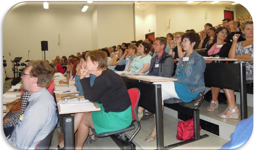
Foto onder: Voorstelling van de rouwkoffer: de rijke inhoud lag uitgestald

naar (Advent en Kerstmis), verder kijken (Goede Week en Pasen) en tot kijk (eindviering). De Veertigdagentijd is de tijd om een 3D-bril op te zetten,